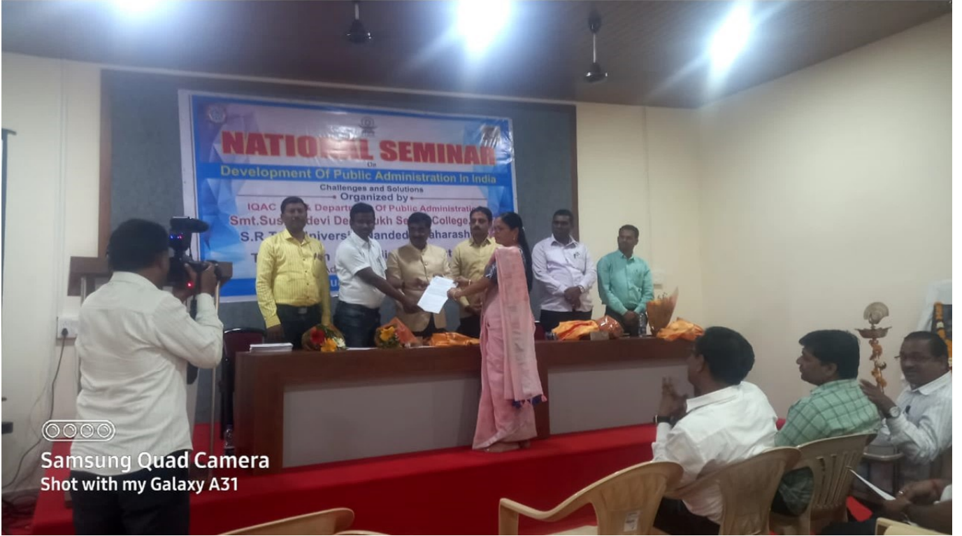
Samsung Quad Camera Shot with my Galaxy A31